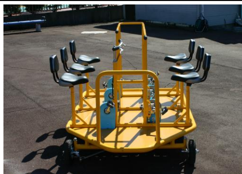
かに走りサイクル改良後