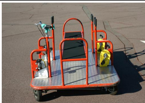
かに走りサイクル改良前

自転車の安全確保に資するため、本センターに於ける不特定多数の来場者による各種自転車の利用データ収集を実施併せてJIS, BAAの自転車安全基準の適合対象外である変り種自転車の利用データ及びアンケート収集し、専門家を交えた「各種自転車の改良研究に係る委員会」において試作車の実用化に向けた検討を行ない、本センター変り種自転車の人気の高い6車種について改良と試作を実施した。