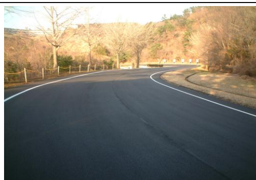
舗装工事・区画線 施工完了